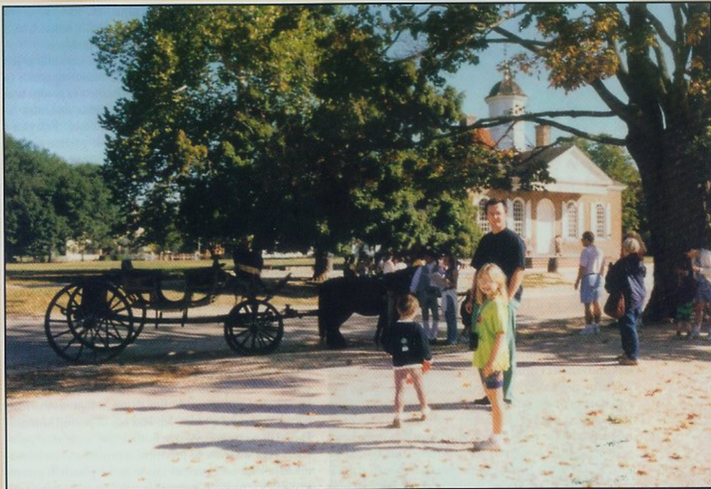
Povijesni gradić Williamsburg

na, kao i trajno boravište Georgea Washingtona. Svako malo mjesto, poput Blacksburga, osim toga ima i svoju bitku s Indijancima, i svoje mitove o hrabrim djevojka-ma koje su se iz indijanskog izgnanstva vratile u civilizaciju.