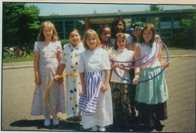
Učenici osnovne škole u Blacksburgu

Pomalo začudno: u tom malom apalačkom mjestu smjestilo se najveće državno sveučilište. Tu se rade projekti s kloniranjem, s hipnozom, s energetikom na razini države, agronomski i biološki projekti po kojima se to sveučilište proslavilo (da navedem samo one o kojima