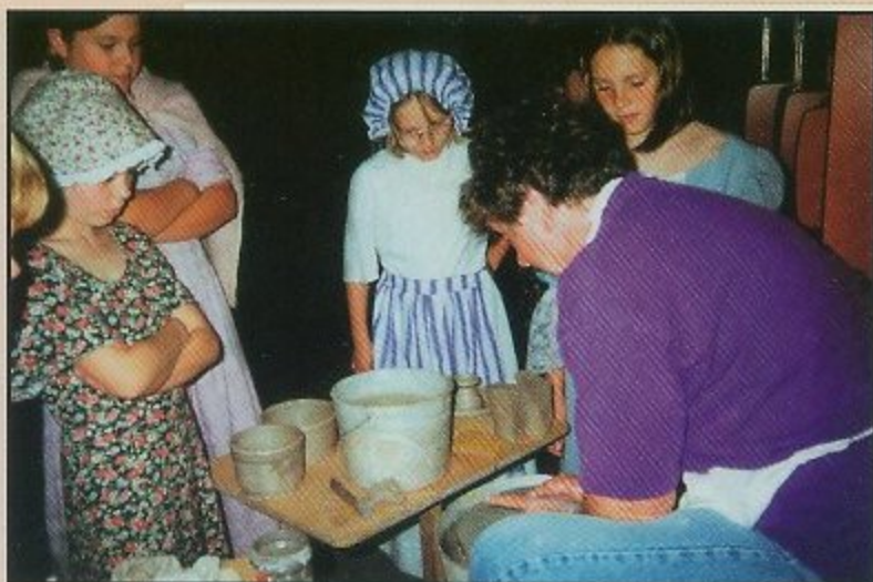
Učenje tradicionalnih obrta u osnovnoj školi u Blacksburgu

tome se misli na loš učinak tjelesnih uživanja, i na povoljno djelovanje trpljenja. Kod nas, prakticirajućih ili nepracticirajućih katolika, vlada suprotno načelo: »što je za tebe dobro, jest dobro, a što je za tebe loše, jest loše«, čime se kaže da su tjelesne ugone dobre, a fizička iscrpljivanja loša. Premda dostupna u golemim količinama, i u relativno širokoj ponudi, hrana je loša. Svi su proizvodi nemasni i bitno je da se to oglašava. Konzervirane ribe nisu u ulju, nego u vodi. Majoneze koja bi odgovarala tome pojmu nema. Putar i masno mlijeko postaje rijetkost. Kruh ne odgovara našim standardima, i treba truda da se pronade odgovarajući. Američke čokolade ne postoje, ili su karikature čokolade. Američki sirovi nisu vrijedni spomena. Srećom postoje grčki i švicarski.